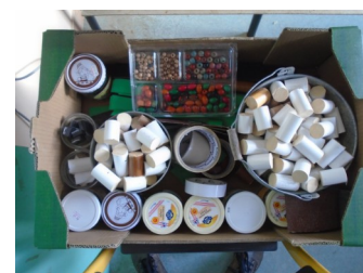
Petit matériel (pions)