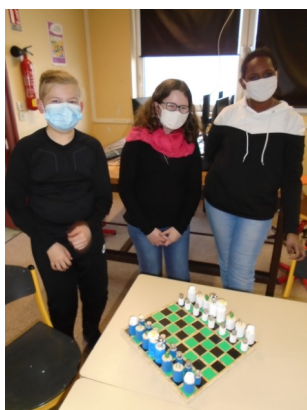
Team Échec 1