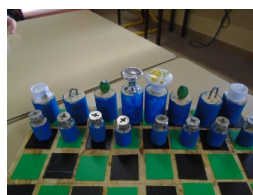
Échec 1 (détails)