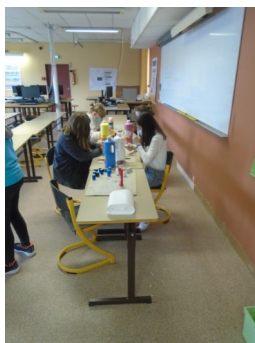
Zone de peinture