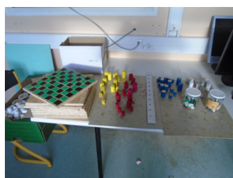
Au bout de deux séances