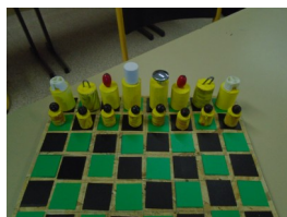
Échec 2 (détails)