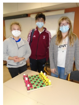
Team Échec 2