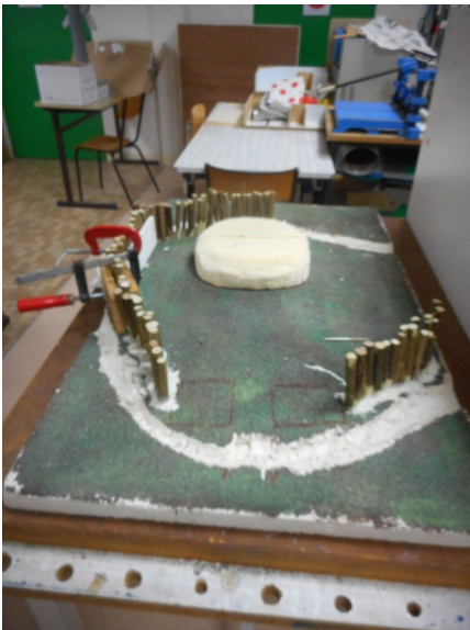
Palissade et motte