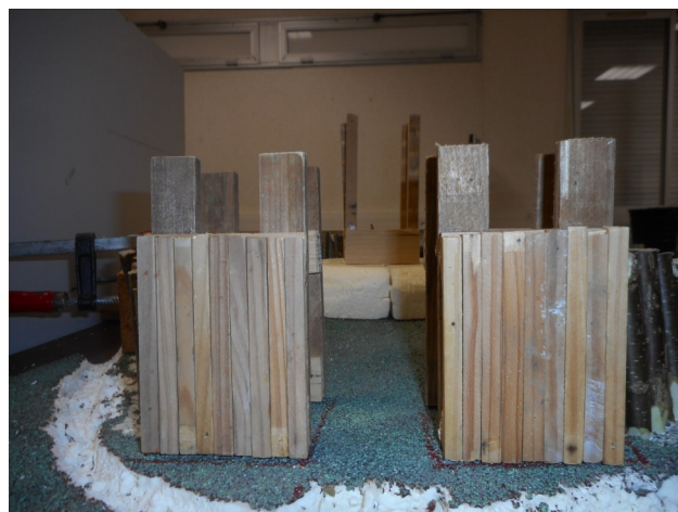
Porte et Tours de garde