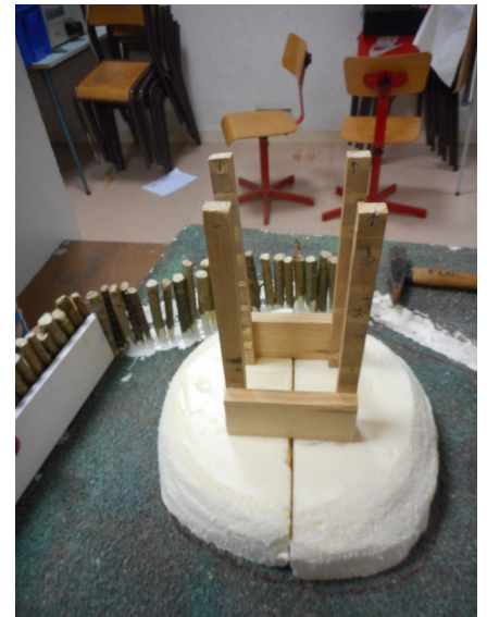
Donjon et motte